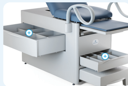
Capacité de rangement de 119 litres