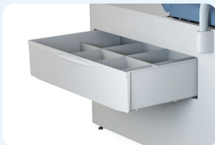
Tiroir latéral très grand