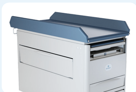
Disponible en version pédiatrique