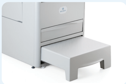
Grand marchepied pour patient, sécurisé et facile à nettoyer