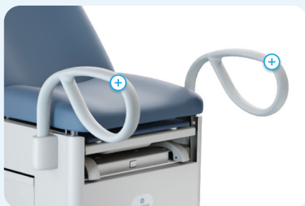
Poignées d'assistance patient multipositions en option