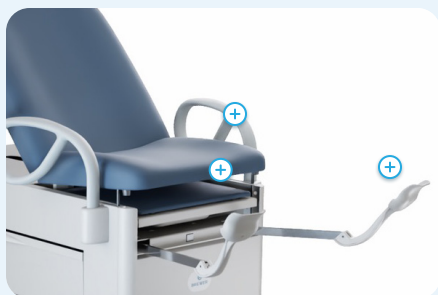
Paquet santé des femmes: Tilt pelvien, Stirups et Drawer Warmer