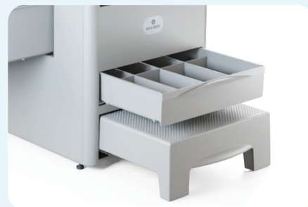
Le tiroir avant inférieur améliore la fonctionnalité